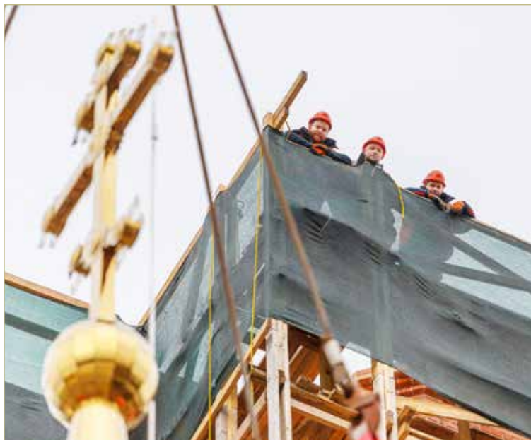
Крест для шпиля освятили в сентябре.

За этим «занавесом» работа не прекращается. Здесь восстанавливают своды, «рассветные