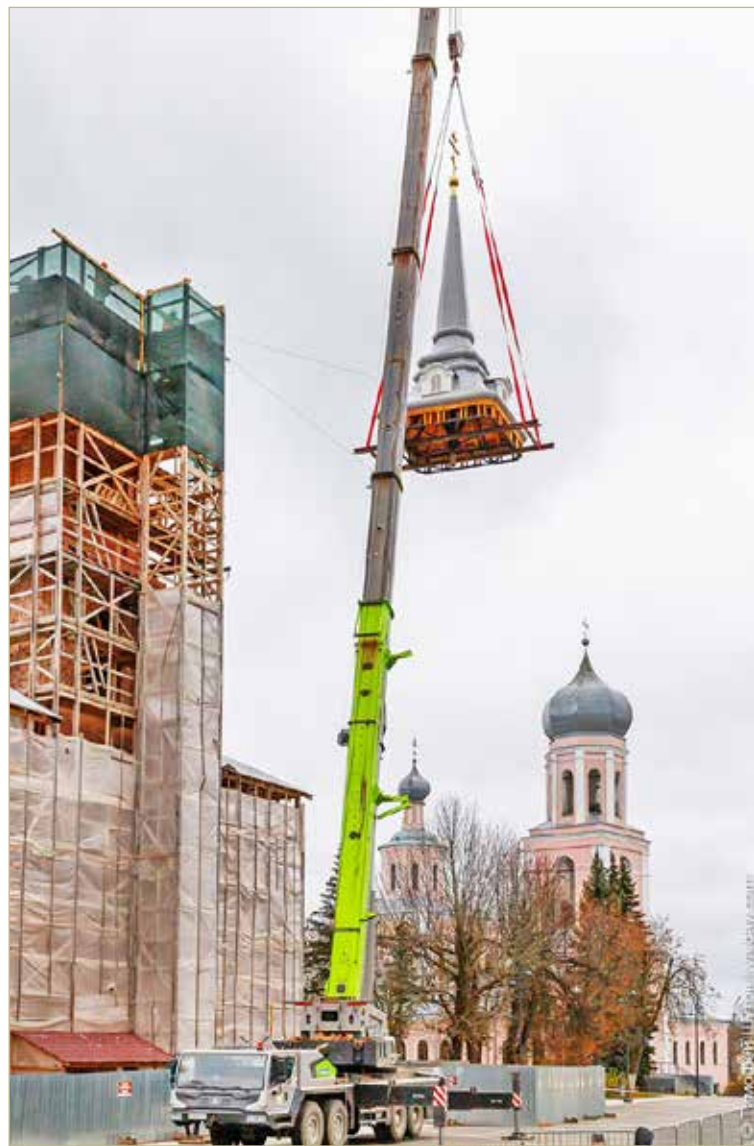
Для монтажа шпиля в Валдае пригнали 100-тонный кран с 70-метровой стрелой.

Историческое место — это звонница, второй ярус колокольни, который в советские годы не уцелел. Его потребовалось полностью восстановить. На стенах в кирпичной кладке сделали монолитные железобетонные пояса с закладными деталями, к которым и приварили остов шпиля.