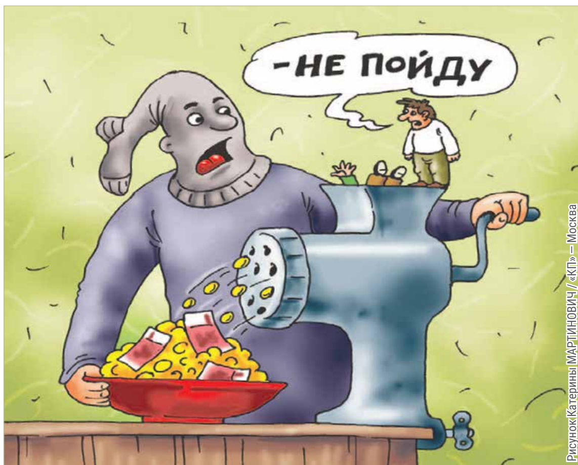
Рисунок Екатерины МАРТИНОВИЧ / «КП» — Москва