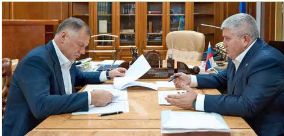
Марат Хуснуллин высоко оценил результаты, достигнутые Новгородской областью.

Новгородская область на сегодня входит в топ-25 лучших регионов России по качеству образования, в топ-3 регионов России по итогам реализации нацпроекта «Образование». Занимает второе место по синхронизации системы среднего профессионального образования с потребностями экономики региона.