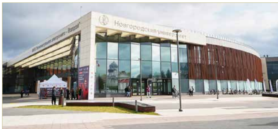
В университете планируют открывать новые лаборатории для научных исследований.

Заместитель руководителя Администрации Президента Максим Орешкин подчеркнул важность получения практического результата от научных разработок, чтобы они в полной мере оправдывали ожидания и служили на благо экономики и общества.