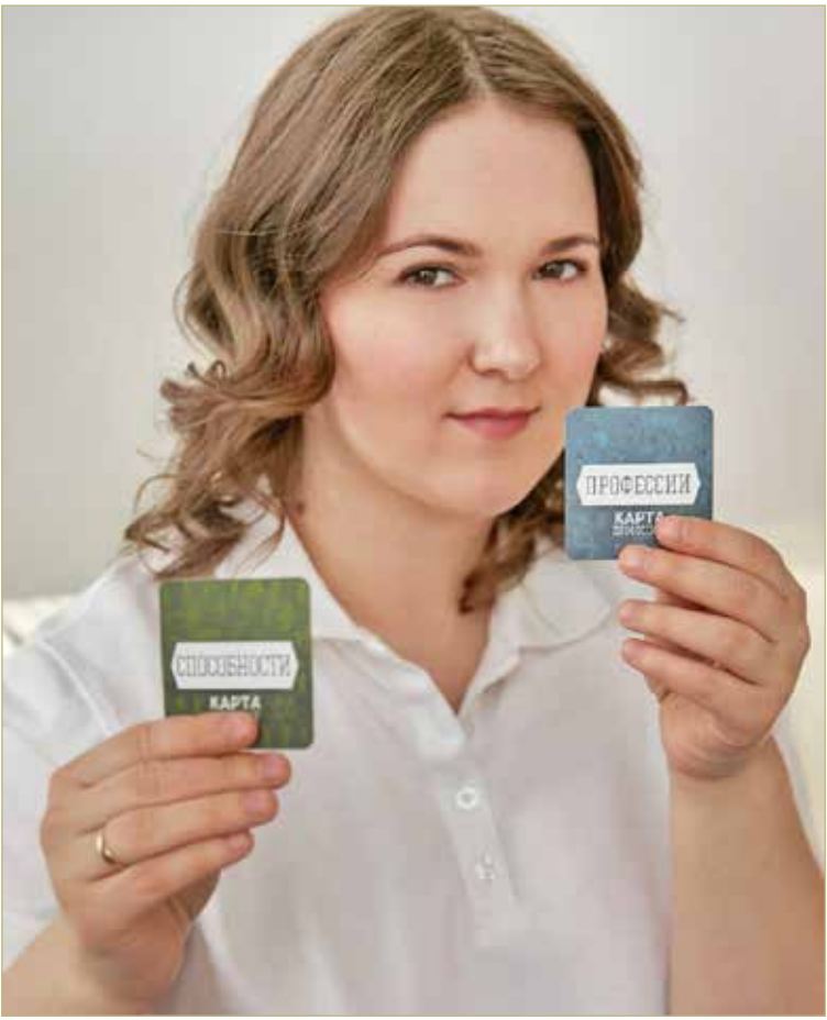
Профориентолог не выберет профессию, но даст грамотный совет.

— Часто клиент приходит с запросом: я ничего не умею