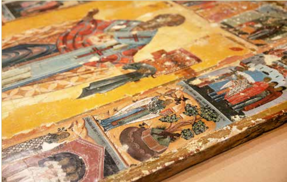
Святителя Николая не зря называют чудотворцем.