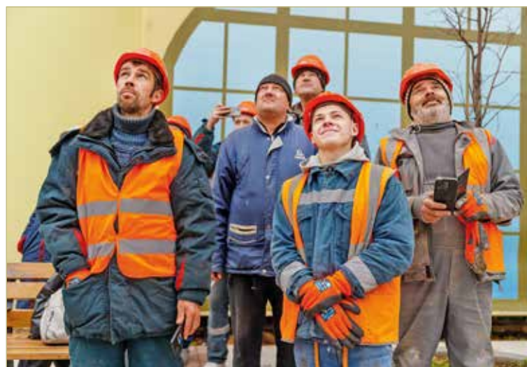
Больше всех за успешный исход дела волновались реставраторы.